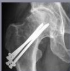
Radiografie van de heupartrose. Kraakbeenslijtage na een vroegere heupbesiek.