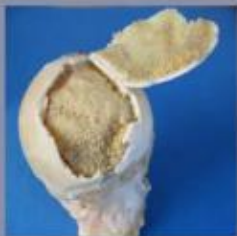
De beschadigde heupkop in werkelijkheid. Het kraakbeen is nog dik en stevig maar het onderliggende bot is afgestorven.