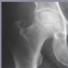
Radiografie van een afgestorven deel van de heupkop. Het kraakbeen is nog intact maar het onderliggende bot is afgestorven.