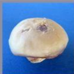
De beschadigde heupkop in werkelijkheid. De heupkop is vervormd en beschadigd.