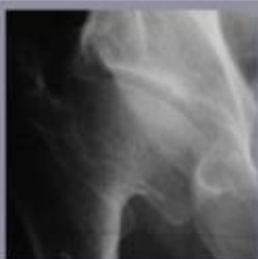
Radiografie van de heupartrose. De kraakbeensdijkgte is een gevolg van een aangetroffen heupvervalsing.