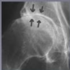
Radiografie van de heupartrose. Het kraakbeen is volledig verdwenen en de gewrichtsruimte is niet meer zichtbaar.