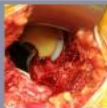
Op de zijkant wordt een opening gemaakt in de heup. De heupkop wordt vastgezet in de heup. Het is nu mogelijk om de heup te bewegen. Het is nu mogelijk om de heup te bewegen.