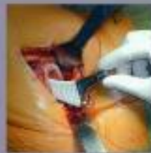
De heupkop wordt vastgezet in de heup. Het is nu mogelijk om de heup te bewegen. Het is nu mogelijk om de heup te bewegen.